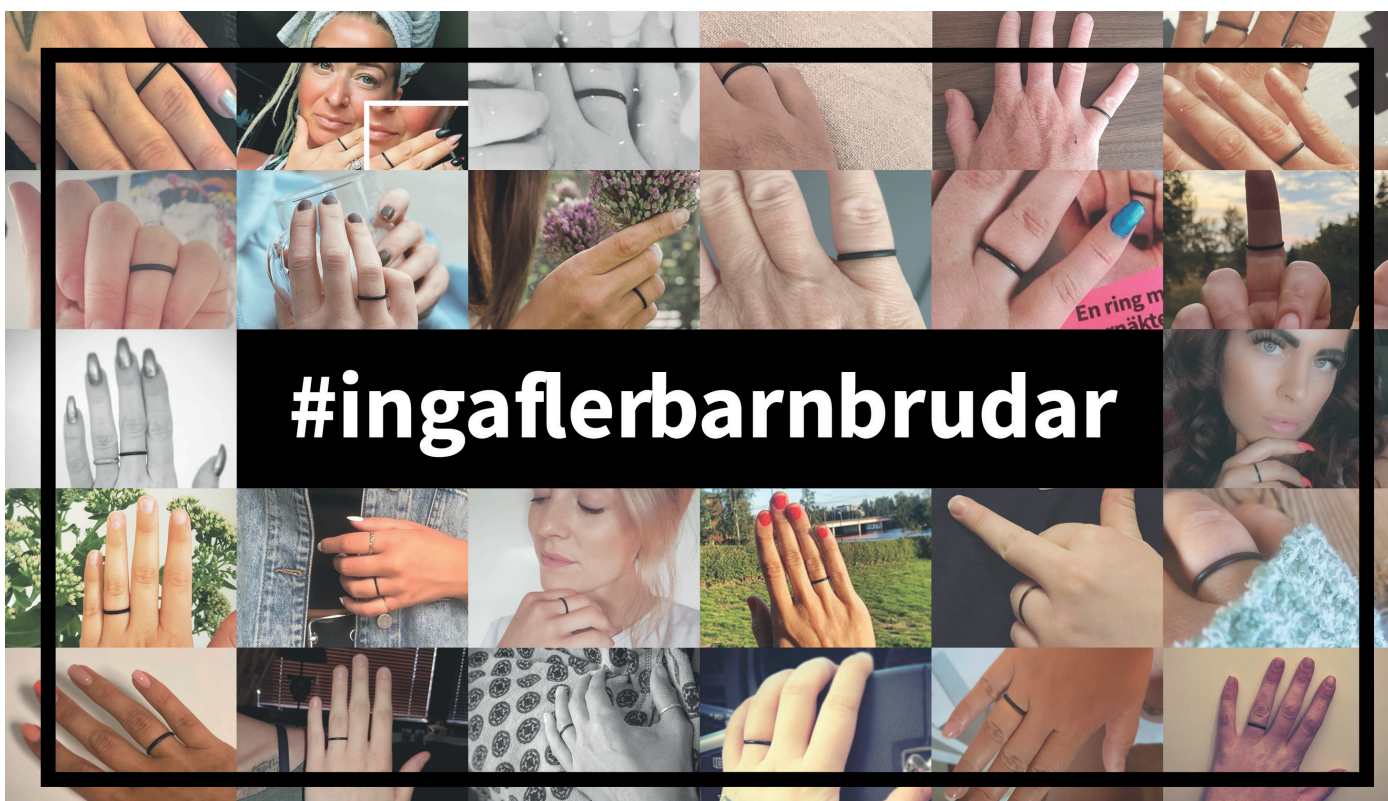
Instagramkampanjen om barnäktenskap engagerade många som spred hashtaggen #ingaflerbarnbrudar.